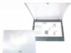
スマートエルライン™ライト (重要負荷分電盤)