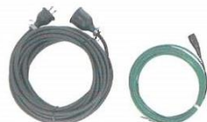
屋外電源用接続ケーブル(10m) ※アースケーブル付き