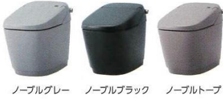
ノーブルグレー ノーブルブラック ノーブルトープ