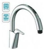
乾電池式B6 (浄水器ビルトイン形) JF-NAB464SYX(JW) ¥147,000