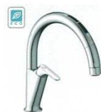
A7 (エコセンサー付) SF-NAA471SY ¥124,000 SF-NAA471SYN ¥127,000