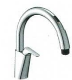
B5 SF-NAB451SYX ¥87,000 SF-NAB451SYXN ¥90,000