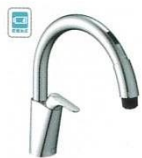
乾電池式B5 SF-NAB454SYX SF-NAB454SYXN ¥97,000