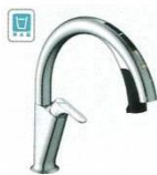
H6 (浄水器ビルトイン形) JF-NAH461SY(JW) JF-NAH461SYN(JW) ¥168,000