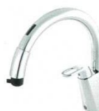
B5 RSF-671A RSF-671NA