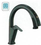
H6 (浄水器ビルトイン形) / サテンブラック JF-NAH461SY/SAB(JW) JF-NAH461SYN/SAB(JW) ¥223,000