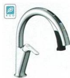
H7 (エコセンサー付) SF-NAH471SY SF-NAH471SYN ¥145,000