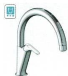
A6 (浄水器ビルトイン形) JF-NAA466SY(JW) ¥153,000