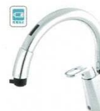
乾電池式B5 RSF-672A RSF-672NA