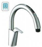
B6 (浄水器ビルトイン形) JF-NAB466SYX(JW) ¥137,000