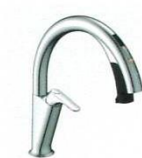
H5 SF-NAH451SY SF-NAH451SYN ¥124,000